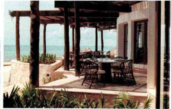
De gauche à droite, le Zanzibar White Sand, le Maroma Belmond et un cocktail du Bob's Bar, un des bars du Brando.